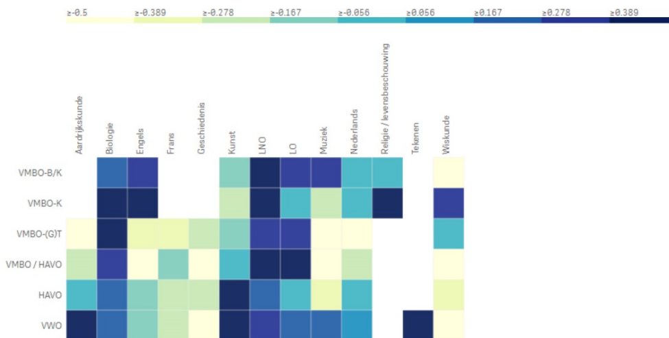
Leerjaar 1 uw school: Verschil gemiddeld cijfer 2020-2019