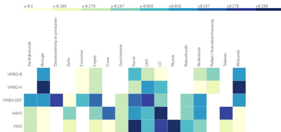
Leerjaar 2 uw school: Verschil gemiddeld cijfer 2020-2019